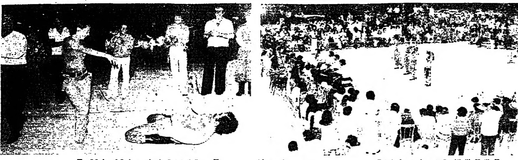
الفرقة الفولكلورية تؤدي رقصاتها

تحت رعاية جمعية رعاية الطفل اللبناني تحتضر مؤتمراً (اليونسيف)